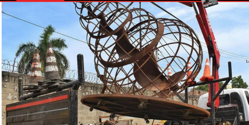
El Caracol es la nueva escultura que hará parte de la exposición bajo el mar del Museo de Arte y Medio Ambiente de Cartagena.